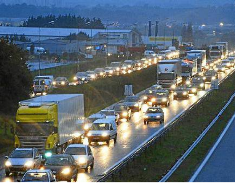
La zone de Kerpont, à proximité immédiate de la RN165, essuie de nombreux embouteillages.

la zone. Des zones qui ont chacune une orientation économique. Celle du Manébos, à Lanester, est plus tournée vers les loisirs avec notamment le parc des expositions du pays de Lorient ou le Méga CGR et ses 1 842 fauteuils numérotés. Une zone d'entrée d'agglomération pour laquelle Lorient Agglomération travaille à une large requalification afin d'en faire une vitrine.